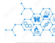
(Plakat: Landratsamt Donau-Ries)

Auch am 4. April (Nacht der Bibliotheken) werden Vorlesestunden stattfinden. Genaueres verraten wir im nächsten Mitteilungsblatt.